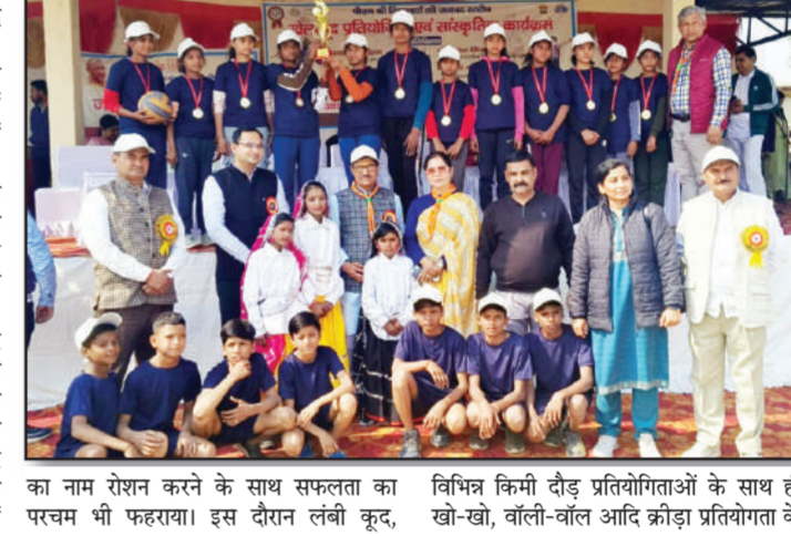
का नाम रोशन करने के साथ सफलता का परचम भी फहराया। इस दौरान लंबी कूद, विषम किमी दौड़ प्रतियोगिताओं के साथ ही खो-खो, वाली-वालि आदि क्रोडा प्रतियोगिता के