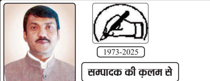
सम्पादक की कलम से