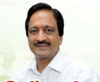
भीमसैन कंसल चेयरमैन एम0जी0 पब्लिक स्कूल