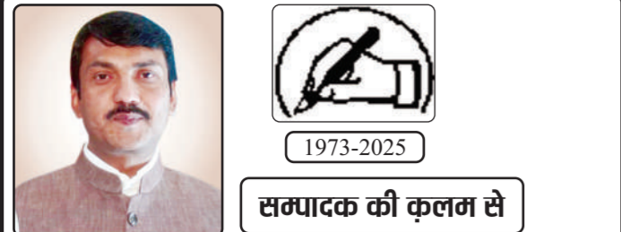
सम्पादक की कलम से