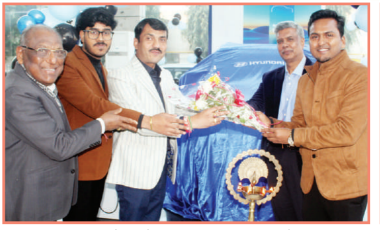
इस गाड़ी की कीमत 17 लाख 99 हजार रुपये से शुरू होती है, जो अलग अलग वैरिएंट के अनुसार 26 लाख रुपये तक चली जाती है। गाड़ी के अंदर