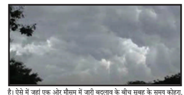
ऐसे में जहां एक ओर मौसम में जारी बदलाव के बीच सुबह के समय कोहरा, दिन में कड़ाके की धूप और शाम होने के साथ सर्द हवाओं के साथ थपड़े की बौच ठंड अपना कहर दिखा रही है, वहीं बुधवार से बारिश को लेकर मौसम

मुज़फ़्फ़रनगर, 22 जनवरी (बु.)। दिल्ली-पुनसीआर के साथ समूचे उत्तर भारत और जनपद में बौते कुछ दिनों से तेज धूप के साथ एक बार फिर से मौसम का मिजाज बदलने के संकेत मिल रहे हैं। हालांकि मौसम विभाग के जारी अलर्ट में रात के समय हल्की बारिश होने की संभावना जताई है, जिसकी वजह से आने वाले दिनों में फिर तापमान गिरेने और सर्दी बढ़ने की संभावना है। अधिकतम तापमान में अगले पांच दिनों के दौरान 4 डिग्री सेल्सियस तक घटने के संकेत हैं। मौसम विभाग के दो दिनों के लिए येलो अलर्ट के बीच आंध्रप्रदेश की ओर से जारी एडवाइजरी में गुरुवार को गज के साथ हल्की बारिश होने की संभावना है। मौसम विभाग के अनुसार बुधवार को न्यूनतम तापमान 9.8 डिग्री व अधिकतम तापमान 24.3 डिग्री सेल्सियस दर्ज किया गया। जिले में आसमान में कोहरा छाए रहने के साथ अब तापमान में कमी आना का अनुमान जताया जा रहा है।