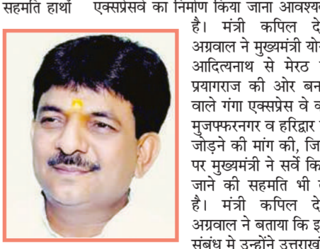
सरकार के मुख्यमंत्री पुष्कर धामी से भी दुरभाग के माध्यम से वातां की है। उन्होंने कहा कि प्रदेश सरकार द्वारा संचालित और प्रकरण एक्सप्रेसवे के माध्यम से कनेक्टिविटी नेटवर्क विकास और क्षेत्र में औद्योगिक परियोजनाओं का विकास हो रहा है। वर्तमान

मुज़फ़्फ़रनगर, 22 जनवरी (बु.)। मंत्री कपिल देव अखलाव ने मुझमेंटी योगी आदित्यनाथ से गंगा एक्सप्रेस-वे को मुज़फ़्फ़रनगर व हरिद्वार तक जोड़ने की मांग की तो सीएम योगी ने सर्वे की सहमति हाथों में लेकर कनेक्टिविटी के लिए बड़े फैसले लिए हैं। पावन त्रिवेणी तट पर हुई कैबिनेट की ऐतिहासिक बैठक में 320 किलोमीटर लंबाई वाले विंध्य एक्सप्रेसवे पर 100 किमी लंबाई वाले विंध्य-पूर्वांचल लिंक