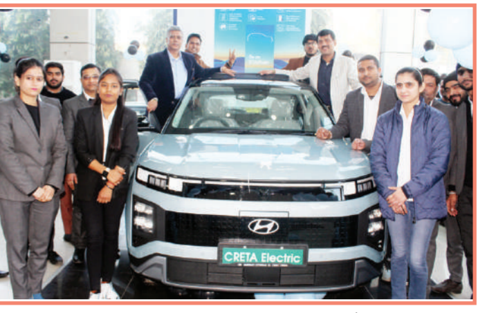
इलेक्ट्रिक गाड़ियों का दौर तेजी से बढ़ता दिखेगा और वर्ष 2030 तक इलेक्ट्रिक गाड़ियों का कारोबार लम्बी छहकेंगें। विश्वसनीय कम्पनी हुण्डई का यह प्रोडक्ट लोगों को अपनी ओर पहले