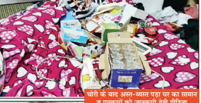
चोरी के बाद अस्त-व्यस्त पड़ा घर का सामान व पत्रकारों को जानकारी देती पीड़िता