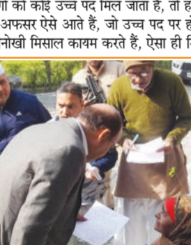
दर्द से कराह रही बीमारी महिला को एम्बुलेंस बुलाकर मेजा अस्पताल