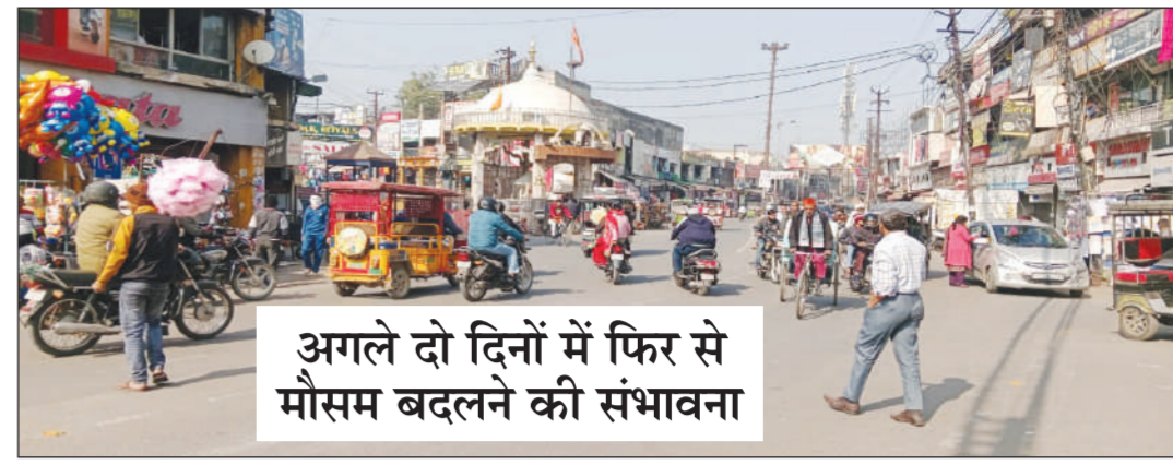
अगले दो दिनों में फिर से मौसम बदलने की संभावना