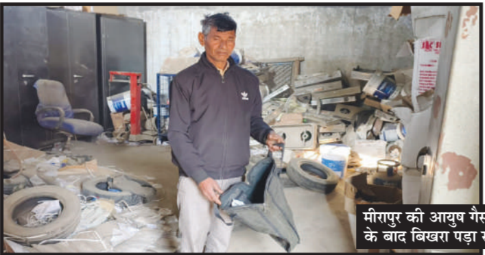
मीरापुर की आयुष गैस एजेंसी पर हुई चोरी के बाद बिखरा पड़ा सामान व टूटा ताला।