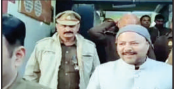
न आने के कारण कोर्ट ने सुनवाई स्थगित करते हुए अब इस मामले की सुनवाई के लिए 2 जनवरी की तिथि नियत की है।