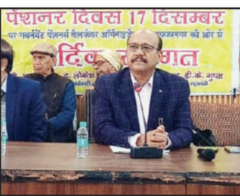
पेंशनर्स दिवस पर डीएम ने सुनी पेंशनर्स की समस्याएं।

30 जून में 31 दिसंबर को सेवानिवृत्त साधियों को एक वेतन वृद्धि का लाभ दिया जाना, मेडिकल बिलों से आबकरी को अभावक कटौती एवं पेंशन राशिकरण को वसूली आदि को 15 वर्ष से घटकर 11 वर्ष किए जाने की मांग रखी।