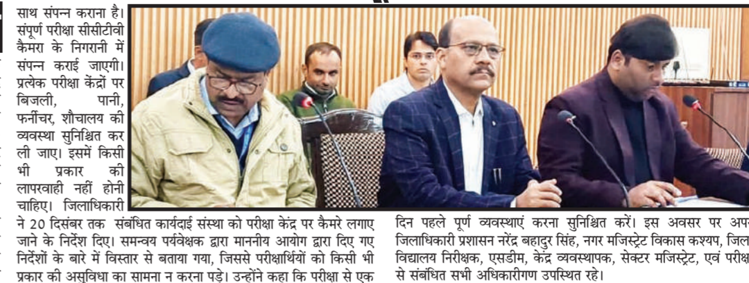
परीक्षा केन्द्रों पर पर्याप्त पुलिस बल तैनात किया जायेगा।

व्यवस्थापकों के लिए सैक्टर मॉनिटर, स्टैटिक मॉनिटर, केन्द्र व्यवस्थापक एवं सैक्टर व्यवस्थापक नियुक्त किए गए हैं। उन्होंने निर्देश दिए कि परीक्षा में जिन कार्मिकों को ड्यूटी लगी है, वह परीक्षा से पूर्व निर्धारित समय पर अपनी-अपनी ड्यूटी पर उपस्थित रहे।