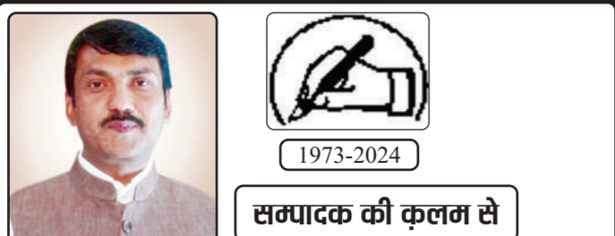
सम्पादक की कलम से