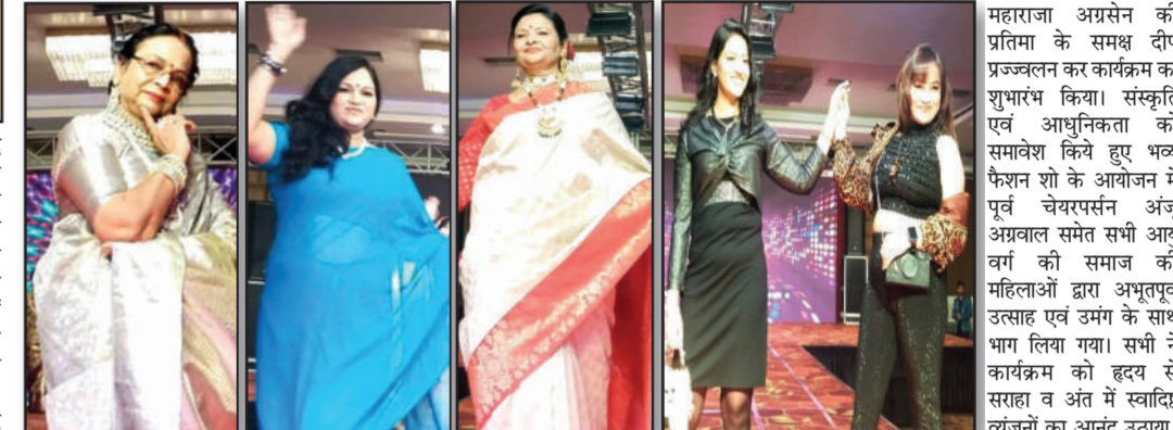
महाराजा अग्रसेन की प्रतिभा के समक्ष दीप प्रज्वलन कर कार्यक्रम का शुभारंभ किया।

मुजफ्फरनगर, 17 दिसम्बर (स्व.ि.)। आशीर्वाद वैद्यकाल में अखिल भारतीय वैश्य अग्रवाल महासभा महिला इकाई द्वारा भव्य एवं आनंददायक फैशन शो का कार्यक्रम आयोजित किया।