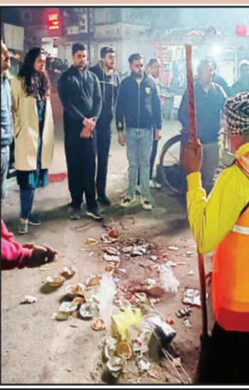
शिवचौक पर चलाया सफाई अभियान।

मुजफ्फरनगर, 17 दिसम्बर (स्व.ि.)। नगर क्षेत्र में शिवचौक के आसपास चारों ओर विशेष टीमों को लगाकर रोड सफाई अभियान चलाया जायेगा ताकि सड़कों पर फेंका कूड़ा रात्रि में उत्तरकर सड़ने नहीं सके।