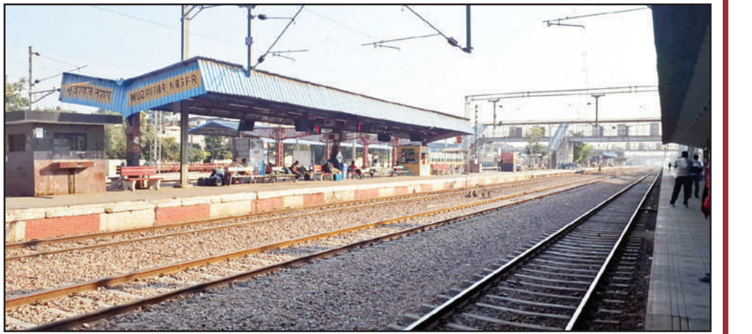
दिल्ली जाने वाली पैसेंजर, कालका से दिल्ली जाने वाली पैसेंजर, मुम्बई से अमृतसर जाने वाली गोल्डन टैम्पल को शांली से होकर निकाला गया। इसके अलावा योगा एक्सप्रेस एक घंटा बीस मिनट, व देहरादून बांद्रा एक्सप्रेस 7 घंटे देरी से पहुंची।

मुजफ्फरनगर, 28 नवम्बर (बु.)। मरठ-सकौती में अंडर पास का काम होने पर गुरुवार को रेल यातायात प्रभावित रहा, जिसमें पूर्व घोषणा के अनुसार 12 से सार्व 6 बजे तक मेगा ब्लॉक किया गया। मेगा ब्लॉक के दौरान कुल 6 एक्सप्रेस ट्रेनें रद्द होने वाली 6 गाड़ियां