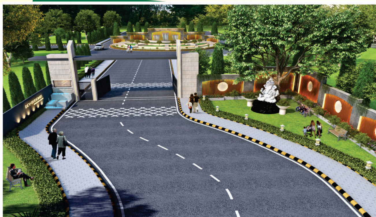
INTERNAL WELCOME PARK