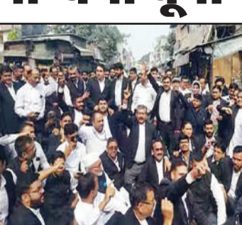
राष्ट्रपति को कार्मि पेशाना का सामना करना पड़ा। ग्रेटर नोएडा के पुरनपुर सिविल जिला अदालत के अधिकाओं ने सोमवार सुबह कलेक्ट्रेट परिसर के बाहर धरना प्रदर्शन कर सड़क जाम किया।