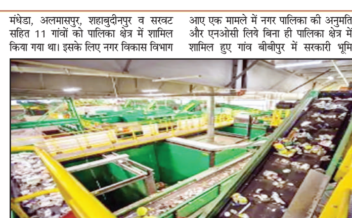
द्वारा 29 सितम्बर 2022 को अधिसूचना जारी होने के बाद में इन क्षेत्रों का समावेश करते हुए पालिका विकास कार्य करा रही है। इन गांवों में सरकारी भूमि को पालिका अपने अधिकार क्षेत्र में लेने को एमआईटीसी सरकारी भूमि को पालिका को करीब दो वर्ष बाद भी हस्तांतरित नहीं किया है।

मुजफ्फरनगर, 11 नवम्बर (बु.)। नगरपालिका सीमा विस्तार के बाद उसके हिस्से में आए क्षेत्र में सुविधा व विकास करने के लिए बने दबाव के बीच एमआईटीसी सरकारी भूमि को लेकर पालिका क्षेत्र में शामिल 11 गांवों की सरकारी भूमि को पालिका को करीब दो वर्ष बाद भी हस्तांतरित नहीं किया है। बड़ी बात यह है कि पालिका को एमआईटीसी के बिना ही तहसील प्रशासन ममाने डेन से सीमा विस्तार में मिले गांवों की सरकारी भूमि को दूसरे विभागों को देकर बंदरबंद करने में लगा है। ऐसी ही सरकारी भूमि पर पालिका ने अपना एमआरएफ सेंटर बनाना प्रारंभ किया तो उस भूमि पर अपना अधिकार बताते हुए अग्रिशमन विभाग ने निर्माण कार्य रुकवा दिया। इसे लेकर पालिका इंडो ने एमआईटीसी सरकारी भूमि को लेकर नाराजगी जताते हुए इस खतीनी में पालिका को नाराजगी और बांडों की अनुमति के बिना अग्रिशमन केन्द्र के लिए भूमि देने की कार्रवाही निरस्त करने के लिए कहा है। बांडों वर्य शासन के द्वारा नगर पालिका परिषद का सीमा विस्तार करते हुए पालिका क्षेत्र से सटे गांव कूकड़ा, सूखड़, सहटना, खानापुर,