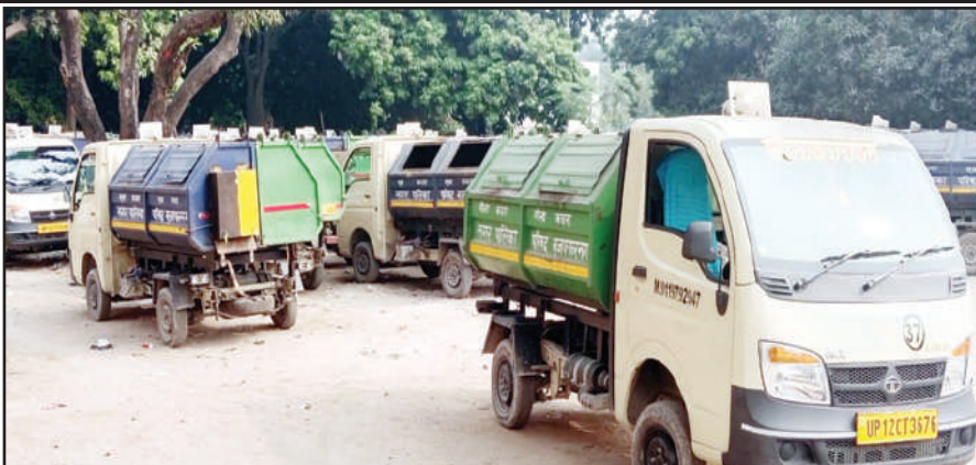
का रोज निस्तारण करने के लिए एमआईटीसी कंपनी द्वारा कार्रवाई की जा रही है। कंपनी शहर

मुजफ्फरनगर, 11 नवम्बर (बु.)। नगरिय क्षेत्र को क्लीन एंड ग्रीन करने की दिशा में शुरू कवायदों के बीच पालिका परिषद से रोज 3 लाख रूपय से अधिक भुगतान प्राप्त करने वाली दिल्ली की एमआईटीसी सिविलिटी एण्ड फैसिलिटी प्रा. लि. अपने कर्मियों के साथ थोड़ा-थोड़ा खेला कर रही है, जिससे आक्रोशित कंपनी के सफाई कर्मियों ने सोमवार से कामबंद हड़ताल कर दी। ऐसे में उक्त कर्मचारी बाहनों को लेकर बाड़ों में कूड़ा कलेक्शन के लिए नहीं निकले और कंपनी के मुख्य कार्यालय में पहुंचकर अफसरों का घेराव करते हुए विरोध प्रदर्शन किया। कर्मियों ने आरोप लगाया कि उनसे कांवड़ में काम कराया, लेकिन आज तक भी उसका तय भुगतान उन्हें नहीं किया है। नगरपालिका प्रशासन के साथ नगर के बाड़ों में डोर डोर कूड़ा कलेक्शन व कूड़ा डलावपर घरों से कूड़े