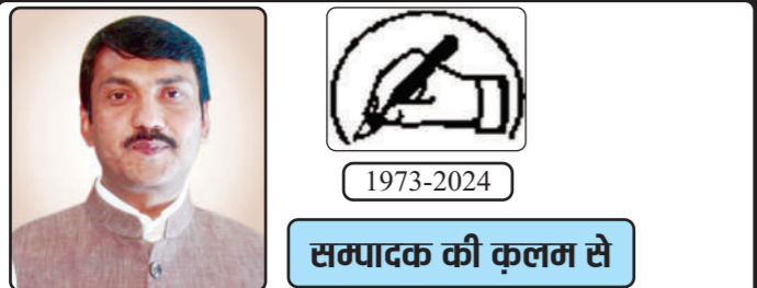
समाप्त की कलम से