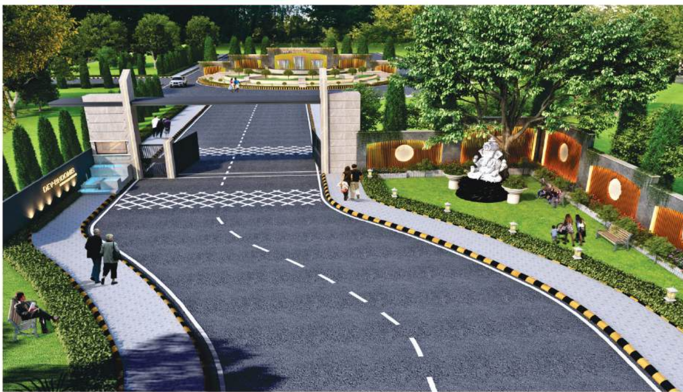
INTERNAL WELCOME PARK