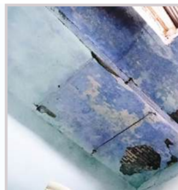
कैबिनि में नहीं था उस वक्त कोई, टला हादसा

मुजफ्फरनगर, 04 अक्टूबर (बु.)। कलेक्ट्रेट के पुराने भवन एक के बाद एक लगातार दरकने शुरू हैं, लेकिन जिम्मेदार मामले में कोई कदम उठाने के बजाए सिर्फ विकल्प तलापने से अधिक कुछ करते दिखाई नहीं देते हैं।