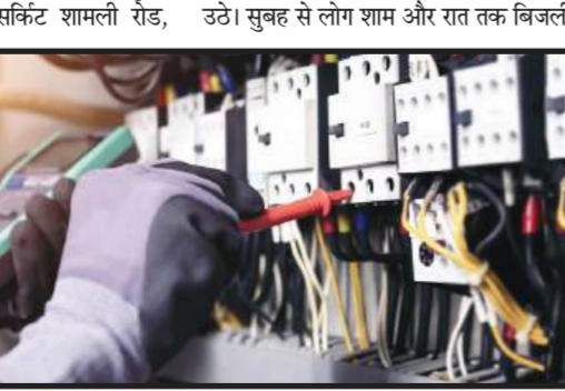
आने का इंतजार करते रहे, लेकिन रात तक भी आपूर्ति बहाल नहीं हुई तो उनके सन्न का बांध टूटने लगा। इसके चलते शामली रोड, गौशाल रोड, मिमलाना रोड, प्रेमपुरी, कृष्णापुरी, सुधरा शाही, भगवत सिंह रोड, रामलाली टीला समेत मुजफ्फरनगर के अनेक इलाकों में आपूर्ति ठप रही। इसके चलते

सीएम पोर्टल पर की गई थी जल भराव की शिकायत, सात अक्टूबर तक मांगा जवाब