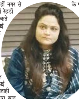
ईओने कहां-ईओ पालिका की सफाई कर्मचारियों को बुलाया है कि शासन के निर्देश पर डलावघरों को बंद किया गया है। वीते तीन दिन डलावघर बंद होने के कारण क्षेत्र में सफाई की व्यवस्था बेहतरी रही है। वही डलावघरों पर कूड़ा नहीं आया है। कुछ प्राइवेट सफाई कर्मचारियों व्यवस्था को बिगड़ने में लगे हुए हैं। कूड़े को बेचने को उक्त लोगों द्वारा ठेका दिया है। इसमें पालिका के कई सफाई नावकों की भी इस बीच भूमिका सदिग्ध बनी हुई है।