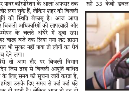
मिमलाना रोड लाईन में क्लीयरेंस करने हेतु उक्त लाइनों के चरत्ते शामली एवं मिमलाना रोड बिजलीघरों की विद्युत् आपूर्ति प्रातः 9:00 से 12:00 बजे तक बाधित रहने की सूचना दी गई थी। इसके चलते सुबह से इन दोनों बिजली घरों से जुड़े बड़े हिस्से में

विपरीत जांचाख्या देने और शिकायती प्रार्थना पत्र का गुणवत्तापूर्ण निस्तारण न किये जाने के संबंध में कारण बताओ नोटिस जारी करते हुए