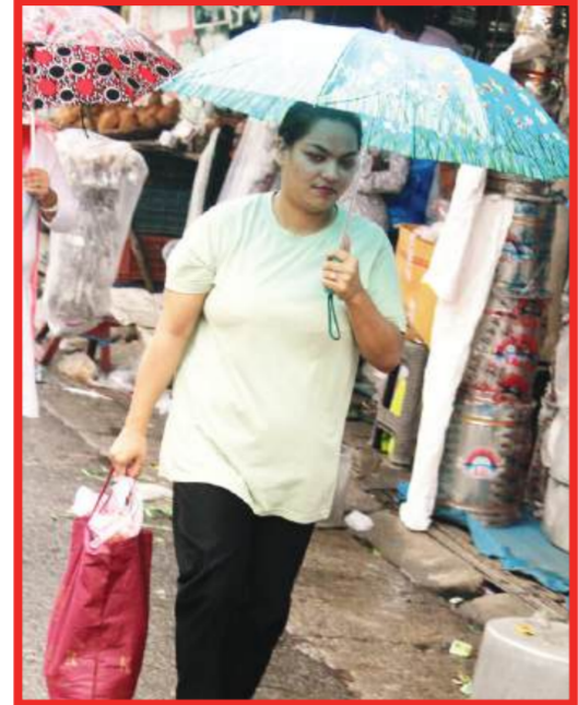
लगातार बारिश हो रही है। पहाड़ों की गनी मसुरी जोदार बारिश के बाद कोरसे से ढक गई और वहां तापमान 15 डिग्री पर आ गया। उत्तराखंड में सुबह से प्रदेशभर में हल्की बारिश जारी है। वहीं, देर शाम बदरीनाथ धाम की ऊंची चोटियों पर भी बर्फबारी हुई। वहीं, यमुनोत्री धाम सहित आसपास खरशालीगांव, जानकीचट्टी, नारायणपुरी, फूलचट्टी, जानकीचट्टी, क्षेत्र में कल शाम से