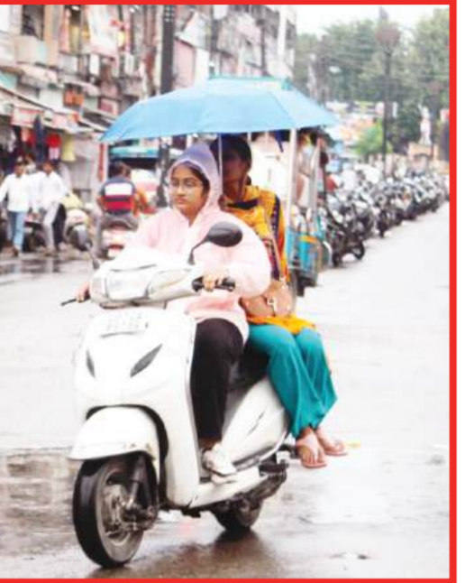
बदरीनाथ की ऊंची चोटियों पर बर्फबारी देहरादून, 18 सितंबर (एजेंसी)। उत्तराखंड में आज भी मौसम खराब बना हुआ है। सुबह से प्रदेशभर में हल्की बारिश जारी है। वहीं, देर शाम बदरीनाथ धाम की ऊंची चोटियों पर भी बर्फबारी हुई। वहीं, यमुनोत्री धाम सहित आसपास खरशालीगांव, जानकीचट्टी, नारायणपुरी, फूलचट्टी, जानकीचट्टी, क्षेत्र में कल शाम से

मौसम में दो दिन खूबकी के बाद आज फिर पूरा दिन तर रहा। इसके चलते बीती रात से आज दिन भर लगातार मिमिमा फुहारों का दौर चला। इसके चलते आज पूरा दिन बारिश से लेकर गलियों तक क्विच क्विच रही। सुबह स्कूलों में बच्चे भी काफी कम तादाद में पहुंचे। इसके बाद दोपहर में उर्ध्व भीगत हुए वापस लौटना पड़ा। बारिश कभी धीमी तो कभी तेज गति से निरंतर जारी रहने के कारण आज बाजारों की रौनक भी फकी रही। शाम को भी बारिश का दौर जारी रहने के कारण चाट बाजार और रेहड़ी खोमचे व पटरी दुकानदारों के लिए बारिश बुरी खबर