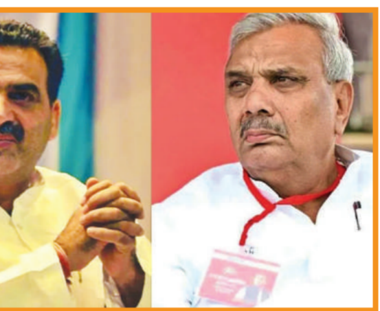
संसद में बोलते हुए मुज़फ़्फ़रनगर की दो विवादित शत्रु सम्पत्तियों को लेकर अनेक सवाल उठाते हुए उत्तर प्रदेश सरकार को घेरने का काम किया था।

मुज़फ़्फ़रनगर, 09 अगस्त (बु.)। जनपद मुज़फ़्फ़रनगर की कुछ शत्रु सम्पत्तियों को लेकर सांसद हरेन्द्र मलिक द्वारा संसद में उठाये गये मुद्दों पर पूर्व मंत्री संजीव बालियान ने दिया जवाब।