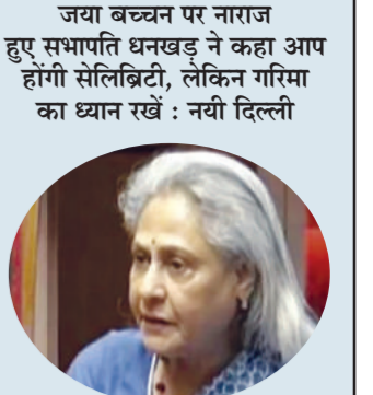
जो लहजा बाहर चल जाता है... वो संसद में नहीं चलता.....