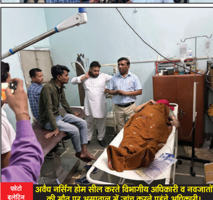
अवैध नर्सिंग होम सील करते विभागीय अधिकारी व नवजातों की मौत पर अस्पताल में जांच करने पहुंचे अधिकारी।