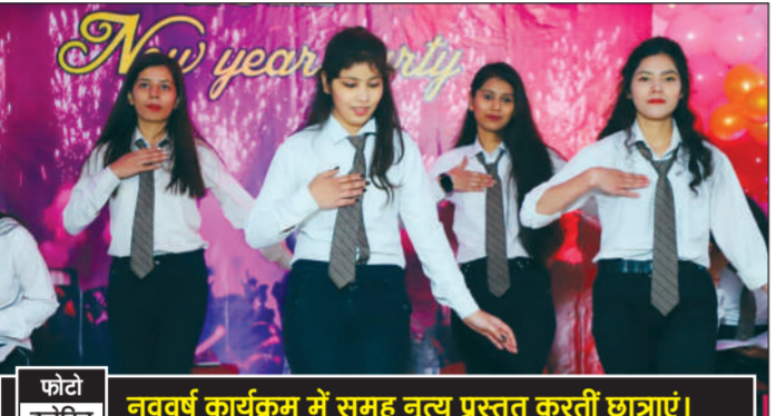
नववर्ष कार्यक्रम में समूह नृत्य प्रस्तुत करती छात्राएं।