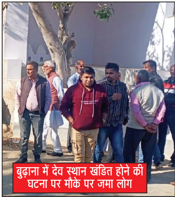
बुढ़ाना में देव स्थान खंडित होने की घटना पर मौके पर जमा लोग