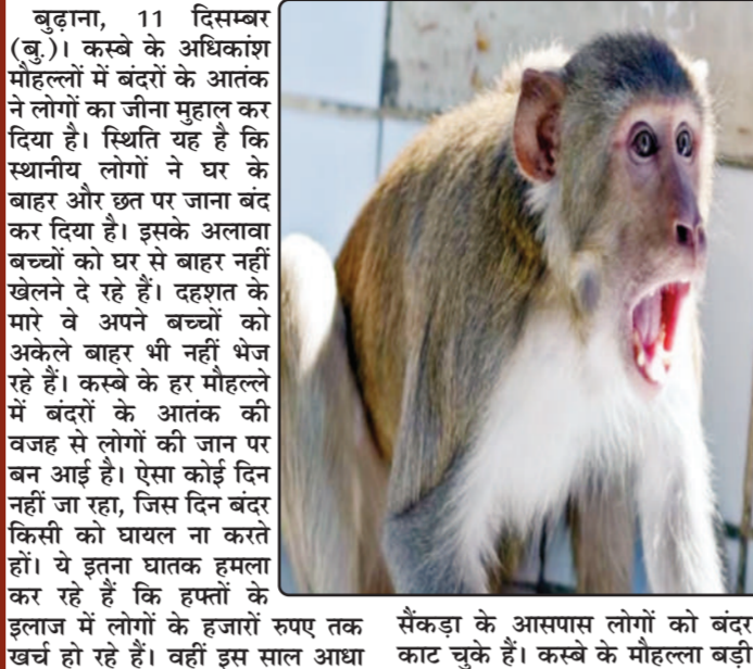
सैंकड़ा के आसपास लोगों को बंदर खंचे हो रहे हैं। वहीं इस साल आधा कठ चुके हैं। कस्बे के मोहल्ला बड़ी

मस्जिद, मोहल्ला मिरदगान, काजीवाडा, घोबियान शाहवाडा सहित अन्य मोहल्लों में बंदरों का सबसे अधिक आतंक है। यहां पर तो बंदरों ने लोगों का जीना हंगाम कर दिया है। स्थिति यह है कि स्थानीय लोगों ने घर के बाहर और छत पर जाना बंद कर दिया है। इसके अलावा बच्चों को घर से बाहर नहीं खेलने दे रहे हैं। दहशत के मारे वे अपने बच्चों को अकेले बाहर भी नहीं भेज रहे हैं। कस्बे के हर मोहल्ले में बंदरों के आतंक की वजह से लोगों को जान पर वन आइ है। ऐसा कोई दिन नहीं जा रहा, जिस दिन बंदर किसी को घायल ना करते हों। वे इतना घातक हमला कर रहे हैं कि हफ्ते के इलाज में लोगों के हजारों रुपए तक खर्च हो रहे हैं। वहीं इस साल आधा