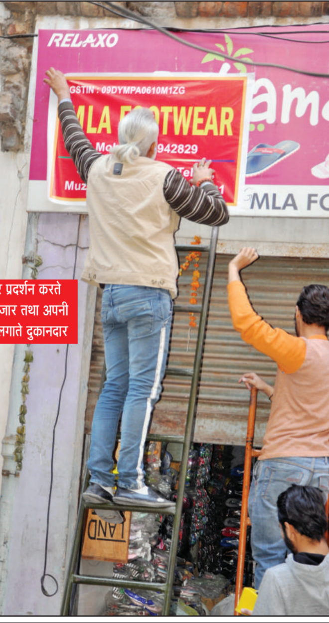
जीएसटी छापों के विरोध में बाजार बंद कर प्रदर्शन करते व्यापारी, बंद पड़ा मोती महल का सराफा बाजार तथा अपनी दुकान के आगे जीएसटी नम्बर की पलैक्स लगाते दुकानदार