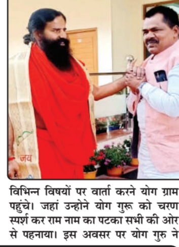
विभिन्न विषयों पर वार्ता करने योग ग्राम पहुंचे। जहां उन्होंने योग गुरु की चरण स्पर्श कर राम नाम का प्रदका सभी की ओर से पहनाया। इस अवसर पर योग गुरु ने