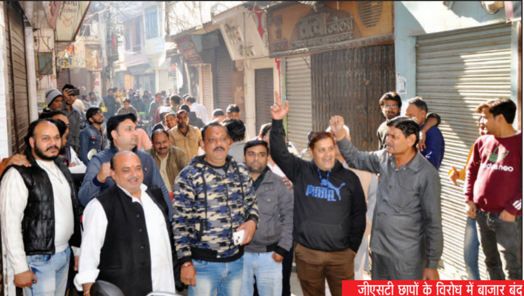
जीएसटी छापों के विरोध में बाजार बंद कर प्रदर्शन करते व्यापारी, बंद पड़ा मोती महल का सराफा बाजार तथा अपनी दुकान के आगे जीएसटी नम्बर की पलैक्स लगाते दुकानदार

हादसे में गन्ना क्राय केन्द्र पर तैनात मजदूर की मौत मुज़फ्फरनगर, 11 दिसंबर (बु.)। नई मंडी कोतवाली क्षेत्र के खेड़ी पंचेडा स्थित गन्ना क्राय केंद्र पर टुक से नीचे गिरकर एक युवक गंभीर रूप से घायल हो गया। मेरठ में उपचार के दौरान उसकी मौत हो गई।