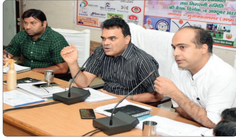
सचिवालय रोटर के हिसाब विकास खंड अधिकारी सचिवालय स्वयं जाकर देखने के निर्देश अनुपस्थित कर्मचारियों के खिलाफ कड़ी से कड़ी कार्रवाई करने के लिए निर्देश एवं अन्य कार्यों/योजनाओं की बिन्दुवार समीक्षा की गयी।

मुजफ्फरनगर, 14 अक्टूबर (सुवि.) डीएम चंद्रभूषण सिंह की अध्यक्षता में जनपद के विकास एवं लाभार्थीपरक योजनाओं सहित विभागों द्वारा संचालित जनकल्याणकारी योजनाओं में प्रगति की स्थिति एवं अन्य सम्बंधित विभागों द्वारा कराये जा रहे कार्यों में प्रगति से सम्बंधित समीक्षा बैठक विकास भवन के सभागार में सम्पन्न हुई। डीएम चंद्रभूषण सिंह ने कृषि विभाग द्वारा संचालित योजनाओं की समीक्षा सरकार द्वारा किसानों को दिये जा रहे अनुदान/छूट खाद बीज की उपलब्धता किसान सम्मान निधि योजना, पाली जलाने का विशेष ध्यान दिया जाए और किसान गेठी की जाए। स्वास्थ्य विभाग द्वारा आयुष्मान भारत योजना के नहत बनाये जा रहे गोल्डन कार्ड धारकों को मिलने वाले स्वास्थ्य लाभों आदि के बारे में भी जागरूक किया जाए। बैठक में विभिन्न लाभार्थीपरक योजनाओं के सफेद आधार सौडिंग करिये जाने के कार्य में प्रगति आदि से सम्बंधित दिशा-निर्देश जिलाधिकारी ने सम्बंधित विभागीय अधिकारियों को दिये। समीक्षा बैठक में डीएम ने विभागवार समीक्षा करते हुए