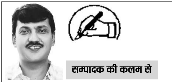
सम्पादक की कलम से