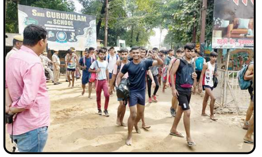
मेट्रो रोड पर युवाओं की टोलियां दिनभर विचरना करती नजर आई।