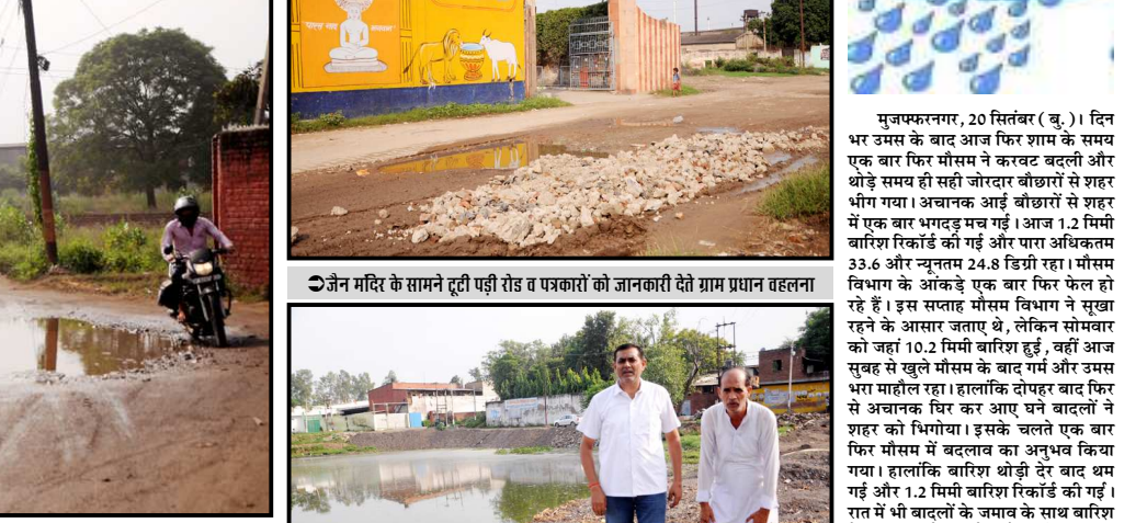
जैन मंदिर के सामने टूटी पड़ी रोड व पत्रकारों को जानकारी देते ग्राम प्रधान वहलना

यह सड़क लोक निर्माण विभाग के अनगर हो गई। ग्राम प्रधान के पास इस सड़क के बनाने का कोई बजट नहीं है। वह खुद पीड़ितों की मदद करने के लिए लिख चुके हैं। उन्होंने बताया कि सड़क पूरी तरह टूटी है और हर तरफ गड्ढों की भरमार है। जैसे जैसे उन्होंने पागे को निकारने के लिए नाला तो बनवा दिया है, लेकिन सड़क उनके बूटों से बचना भी नहीं है। जैन मंदिर के लोग भी इस सड़क के निर्माण के लिए प्रयासरत हैं। प्रधान ने बताया कि 2 अक्टूबर को मेले में लाखों श्रद्धालु यहां पहुंचेंगे, ऐसे में प्रशासन और लोक निर्माण विभाग को कम से कम गड्ढों को तो भर देना चाहिए, ताकि जलभराव की समस्या से मुक्ति मिल सके। उत्तर जैन मंदिर के पदाधिकारियों का कहना है कि वह तो अहिंसा के पुजारी हैं, इस कारण कोई भी उनकी बात सुनने को तैयार नहीं है। पश्चिमी उत्तर प्रदेश के इस बड़े जैन तीर्थ के विकास को लेकर सरकार और जनप्रतिनिधि दोनों ही उदासीन हैं।