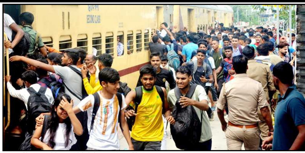
अग्निवीर भर्ती में प्रतिभाग करने के लिए नगर के रेलवे स्टेशन पर उमड़ी अर्धधियों की भीड़। फोटो बुलेटिन

बाला राह। बीती रात से ही कतार में लगे युवाओं को उनके कागजों की जांच के बाद पहली बाधा से गुजरना पड़ा। पहली बाधा थी कद की। इसके लिए 170 सेंटीमी की सीमा निर्धारित की गई थी। ऐसे में दौड़ के लिए स्टैडियम में प्रवेश से पहले कद की जांच में ही एक हजार से अधिक युवाओं को बाहर हो जाना पड़ा। ऐसे में यह युवा इस बात को लेकर चर्चा करते दिखाई दिए कि ऊंचाई की इस बाधा को लेकर उन्हें पहले जानकारी नहीं थी। ऐसे युवाओं को तमाम मेहनत के बावजूद निराशा होना पड़ा। इसके बाद से दूसरी परीक्षा थी दौड़ में अपना दमखम साबित करने की। इसके लिए चले गए 8300 युवाओं को करीब तीन-तीन सौ की टोलियां बनाई गई थीं। इसमें उन्हें एक साथ दौड़ना था। जाहिर है कि इतनी संख्या में जो पिछड़ गया उसे आगे निकलने का मौका ही नहीं मिला। मैदान के