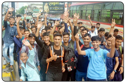
रोडवेज बस स्टैंड पर अग्निवीर भर्ती के लिए आए युवाओं का जोश।