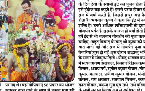
महाराज श्री ने कहा कि भगवान कृष्ण अपनी सखाओं व गोप-यात्राओं के साथ गोवर्धन पर्वत पर गए थे। यहां गोपिकाएं 56 प्रकार का भोजन रखकर नाच गाने के साथ में उत्सव मना रही थी।