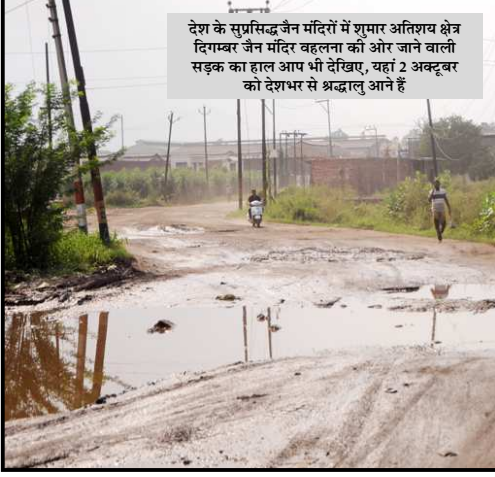
देश के सुप्रसिद्ध जैन मंदिरों में शुमार अतिशय क्षेत्र दिगम्बर जैन मंदिर वहलना की ओर जाने वाली सड़क का हाल आम भी देखिए, यहां 2 अक्टूबर को देश भर से श्रद्धालु आने हैं