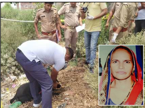
मृतका सरोज का फाईल फोटो व घटना की जांच करता डॉंग स्वचाल्य।