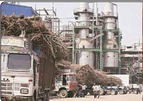
चीनी मिलों से 60 एलएमपी से ज्यादा चीनी का उठान हो चुका है। और 16 अगस्त तक 55 एलएमपी से ज्यादा का निर्यात हो चुका है। कुछ चीनी मिलों ने आगामी चीनी

नयी दिल्ली, 20 अगस्त (वार्ता) चीनी के निर्यात और गन्ने से एथनॉल बनाने में बढ़ोतरी से किसानों को गन्ना मूल्य भुगतान में तेजी आई है, इसके बावजूद किसानों का चीनी मिलों पर 8,909 करोड़ रुपये का बकाया है। वर्तमान चीनी सत्र 2020-21 में चीनी मिलों ने लगभग 90,872 करोड़ रुपये के गन्ने की खरीद की गई, जो अभी तक का रिकॉर्ड है। इसमें से लगभग 81,963 करोड़ रुपये के गन्ना बकाये का किसानों को भुगतान कर दिया गया और 16 अगस्त तक किसानों का चीनी मिलों पर 8,909 करोड़ रुपये का बकाया है। पिछले चीनी सत्र 2019-20 में लगभग 75,845 करोड़ रुपये के देय गन्ना बकाये में से 75,703 करोड़ रुपये का भुगतान किया गया और सिर्फ 142 करोड़ रुपये का बकाया लंबित है। खाद्य एवं आपूर्ति मंत्रालय के अनुसार सरकार गन्ना किसानों के गन्ना बकाये का समग्र भुगतान सुनिश्चित करने और कृषि अर्थव्यवस्था को बढ़ावा देने के उद्देश्य से अतिरिक्त चीनी के निर्यात और चीनी को एथनॉल में परिवर्तित