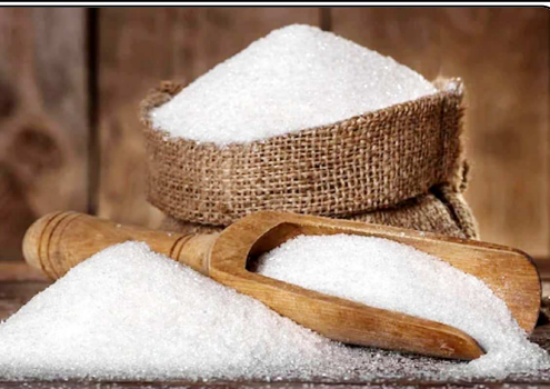
कौमंतों को स्थिर रखने में सहायता मिली है। अतिरिक्त चीनी की समस्या का स्थायी समाधान खोजने के क्रम में, सरकार चीनी मिलों को अतिरिक्त गन्ने से एथनॉल बनाने

को प्रोत्साहित कर रही है, जिसे पेट्रोल के साथ मिलाया जाता है। इससे न सिर्फ हरित तेल का उद्देश्य पूरा होता है बल्कि कच्चे तेल के आयात के मद में विदेशी मुद्रा की भी बचत होती है। चीनी मिलों द्वारा एथनॉल की बिक्री से मिले राजस्व से किसानों के गन्ना बकाया के भुगतान में भी सहायता मिलती है। पिछले दो चीनी सत्रों 2018-19 और 2019-20 में लगभग 3.37 एलएमपी और 9.26 एलएमपी चीनी से एथनॉल बनाया गया है। वर्तमान चीनी सत्र 2020-21 में 20 एलएमपी से एथनॉल बनाए जाने का अनुमान है। आगामी चीनी सत्र 2021-22 में लगभग 35 एलएमपी चीनी को परिवर्तित किए जाने का अनुमान है और 2024-25 तक 60 एलएमपी चीनी को एथनॉल में परिवर्तित करने का अनुमान है। पिछले तीन चीनी सत्रों में चीनी मिलों/डिस्टिलरियों ने तेल विषयक कंपनियों (ओएमसी) को एथनॉल की बिक्री से लगभग 22,000 करोड़ रुपये का राजस्व अर्जित किया है। वर्तमान चीनी सत्र 2020-21 में चीनी मिलों द्वारा ओएमसी को एथनॉल की बिक्री से लगभग 15,000 करोड़ रुपये का राजस्व मिल रहा है, जिससे चीनी मिलों को किसानों को गन्ना बकाये का समग्र भुगतान करने में सहायता मिलती है। पिछले