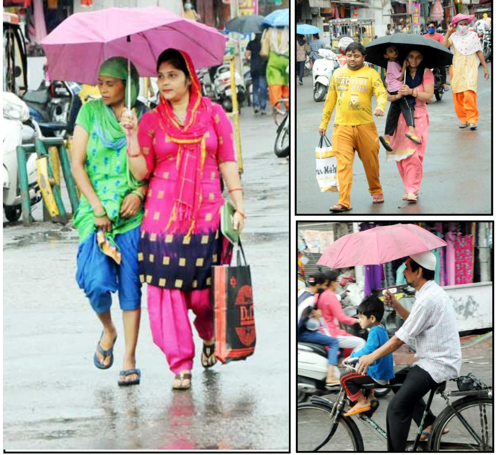
शुकवार को हुई रिमझिम बरसात के बीच से होकर लोग छाने का सहारा लेकर अपने-अपने गंतव्य को जाते हुए।